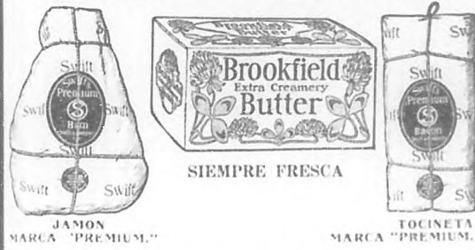
JAMON MARCA "PREMIUM."